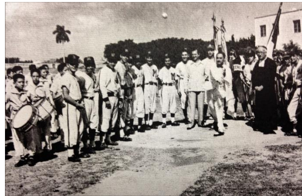
Campo de Baseball de la izquierda

Primera bola a nombre del Alcalde de Marianao- Alumnos Vs. Antiguos Alumnos