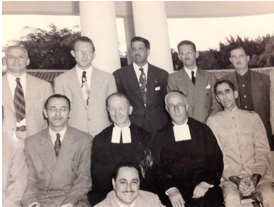
Asoc. Padres de Familias DLS 1950