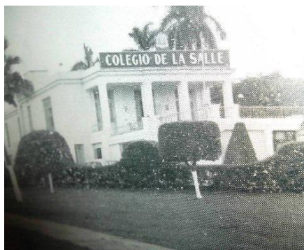
Frente y entrada del Colegio – Calzada Real