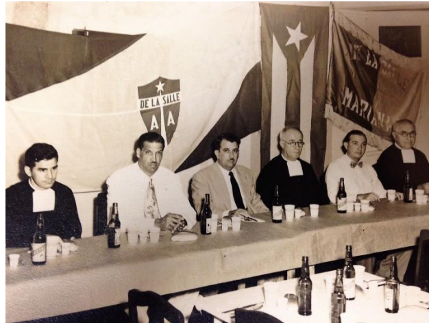
Banquete Asoc. Ant. Alumnos DLS