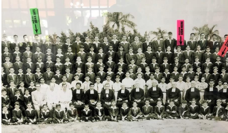
Alumnos – HH – Profesores 1949/50