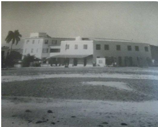
Campo de Baseball de la derecha