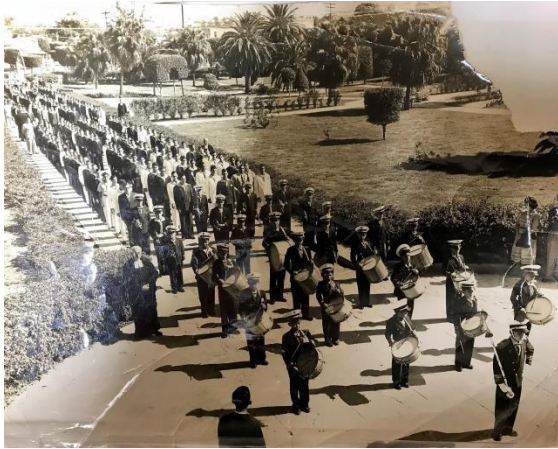
Banda del Colegio en la entrada