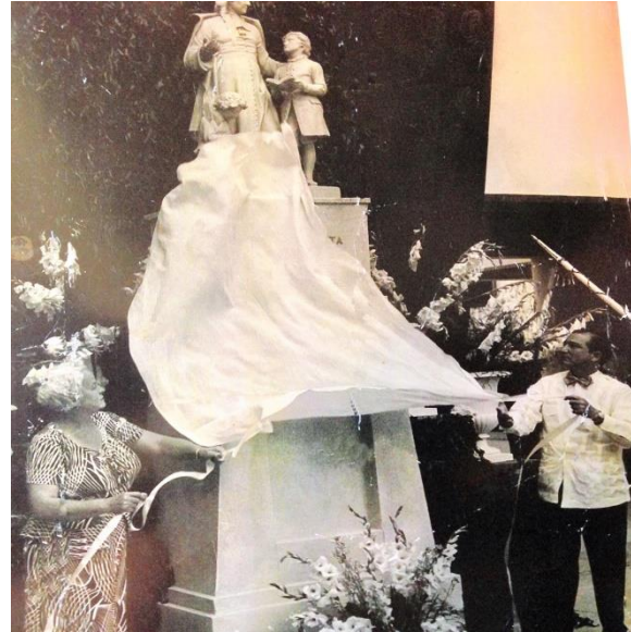
Busto del Fundador 300 Aniversario