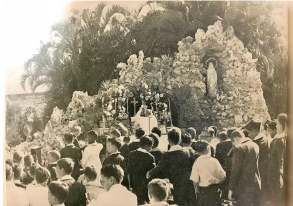
Gruta de Nuestra Sra. De Lourdes