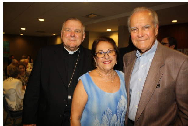
Monseñor Wenski con el Comisionado Javier Souto