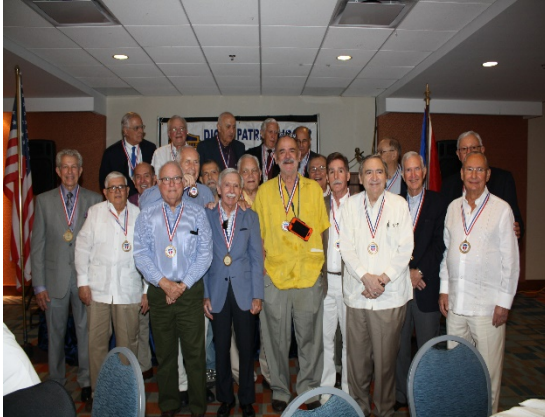
Vedado – Promoción 1958. Medallas de 60 años de graduación.