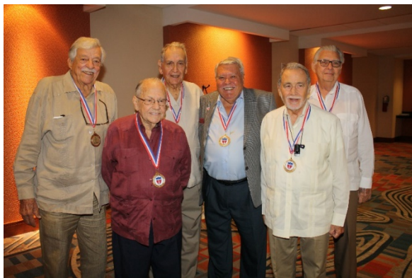
Vedado – Promoción 1948. Medallas de 70 años de graduación.