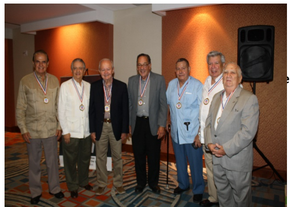
Academia – Promoción 1958. Medallas de 60 años de graduación.