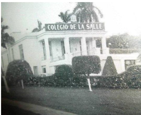
Frente y entrada del Colegio – Calzada Real