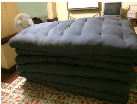
Cuba 2017. Colchonetas para Campamento Juvenil