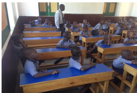
Haití 2018. Pupitres. Colegio San José y SJBDLS