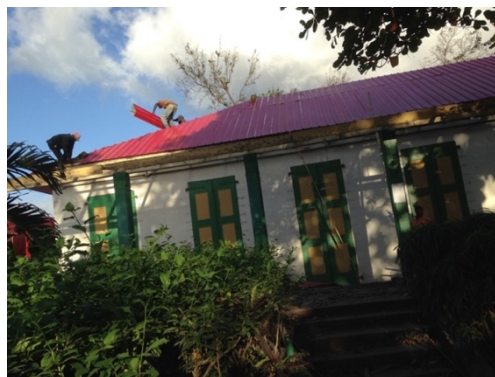
Haití 2017 Reparación del techo – Colegio San José y SJBDLS